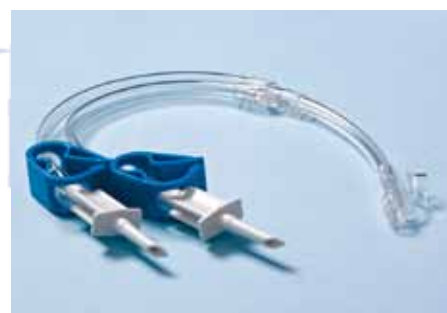
Réf: CAN DP5

Le set d'irrigation et d'aspiration est conditionné dans un sachet pelable et stérilisé à l'ETO selon la norme NF EN ISO 11135-1.