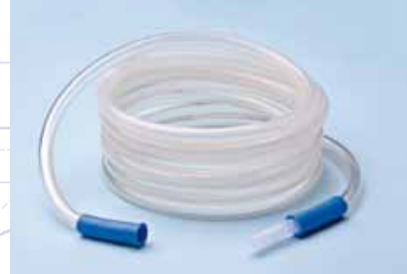
Réf: RAL 3000