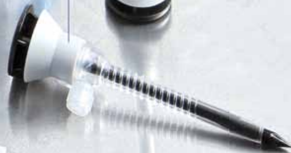
Trocart 5 068