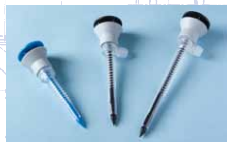
REF : 5 053, 5 068, 5 100