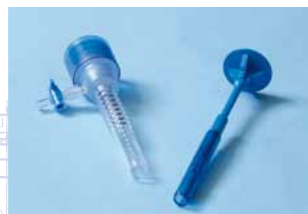
REF : 11 100 S