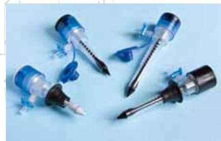
REF : 12 060, 12 060H, 12 100, 12 100H