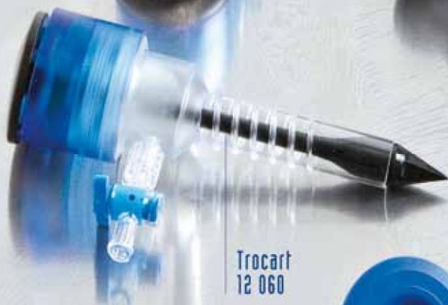
Trocart 12 060